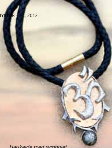
Halskæde med symbolet Om og en graveret perle i bunden.